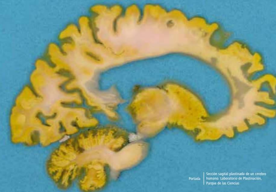
Portada | Sección sagital plastinada de un cerebro humano. Laboratorio de Plastinación, Parque de las Ciencias